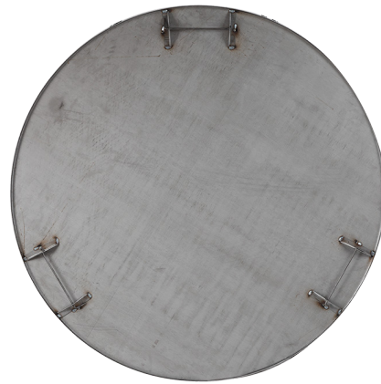
Mâm khóa chốt

Allen là công ty đầu tiên đưa ra sáng kiến, sản xuất và lắp đặt mâm từ năm 1989. Từ đó, độ phẳng mặt sàn FF được tăng lên rõ rệt.