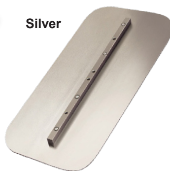
Lưới kết hợp